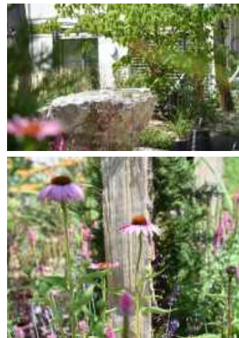
Gestaltung Privatgarten, Planung und Ausführung 2020/2021 by KelArt GmbH